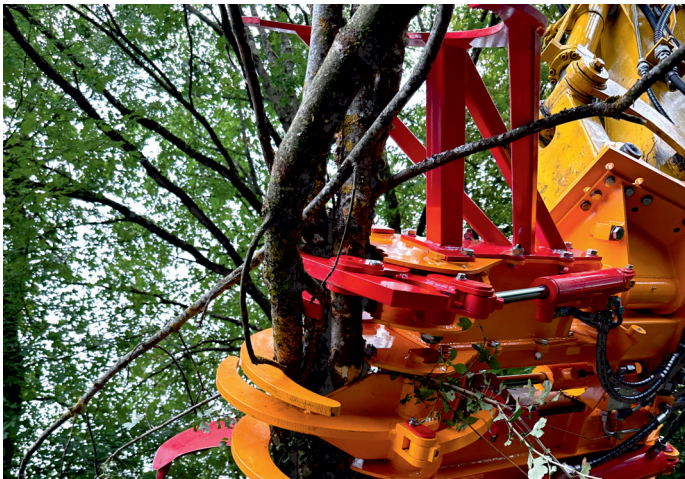
Schnitt-Griffy HS 800 SE mit SG 800 im Einsatz