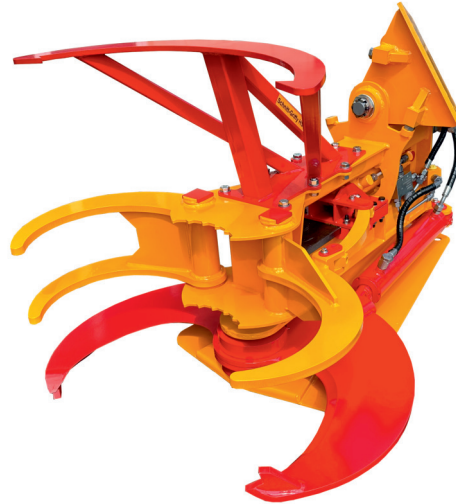
Schnitt-Griffy HS 800 SE