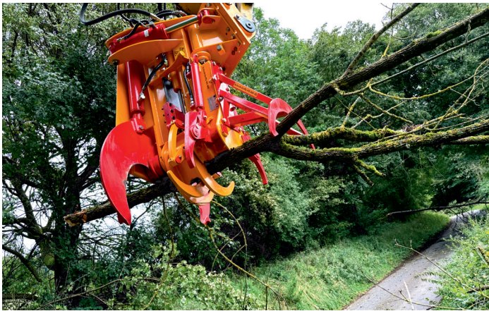
Schnitt-Griffy HS 800 SE mit SG 800 im Greifermodus